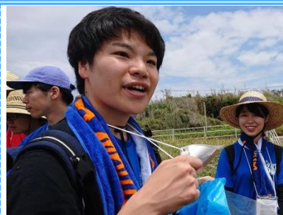
表浜BLUE WALK2019 プロジェクトリーダー